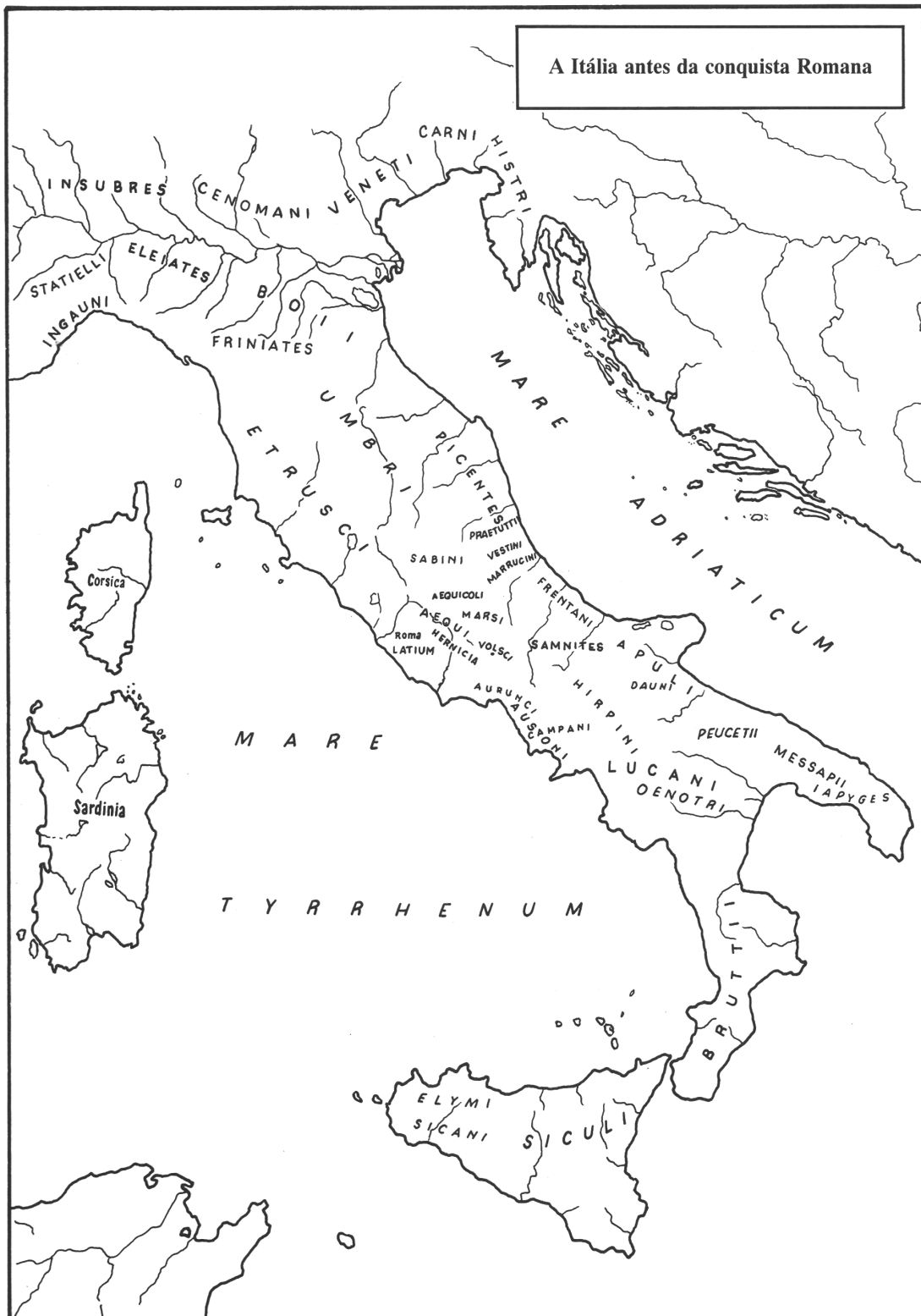
Figura 2 – A Itália antes da conquista Romana